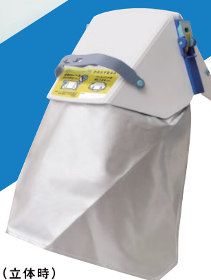
本体背面（立体時） ・ずきん部は後頭部のみを覆う仕様。

タタメットズキン2をベースに、機能とコストバランスをリーズナブルに見なおした普及版発売。